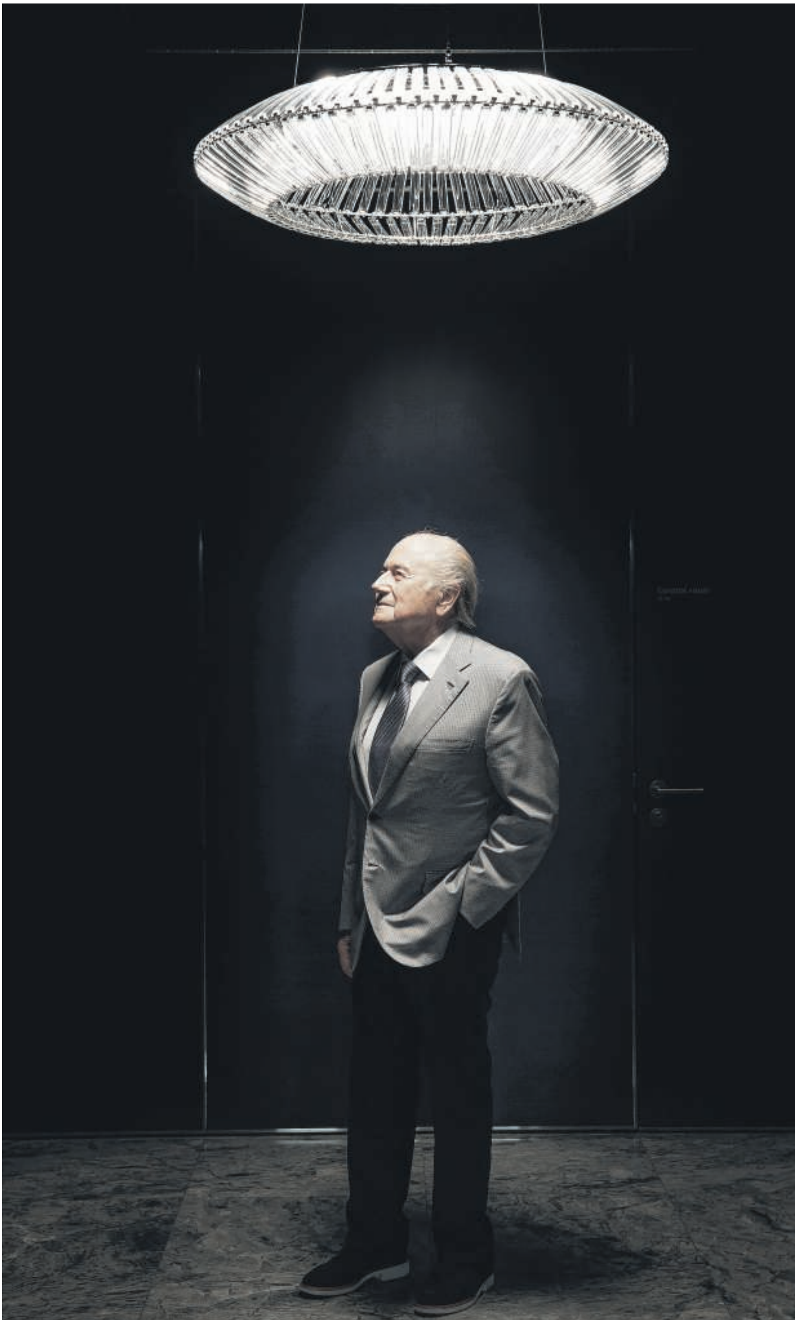
Sepp Blatter: 'Ik heb het gedaan om de organisatie en mijn familie te beschermen tegen de aanvallen. Mezelf kan ik wel beschermen.'